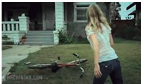
Figura 5- episódio 1, da websérie Torn Apart . (NICOTERO, 2011)

No primeiro episódio da série televisiva, Rick Grimes utiliza uma bicicleta que achou na rua para chegar até à casa do personagem Morgan, onde irá receber a notícia de que o mundo foi invadido por um vírus zumbi. Rick pega a bicicleta num local onde uma zumbi de cabelos loiros, com metade do corpo decepado, tenta morder o protagonista da série. Na websérie, acompanhamos a história da personagem loira antes dela ser contaminada. Porém, além da dramaturgia, a imagem da bicicleta vermelha e da mulher de cabelos loiros faz o espectador se lembrar do primeiro episódio da série televisiva e conectar a imagem da websérie com a da série. Pela justaposição de imagens das diferentes mídias, é perceptível que ambas as histórias fazem parte do mesmo universo e, segundo Kulechov, constroem um novo sentido que