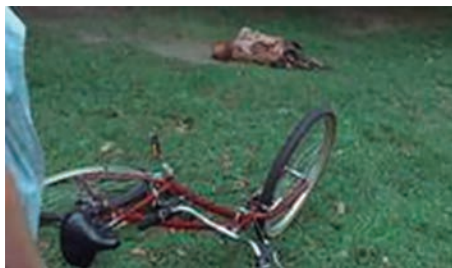
Figura 4- episódio 1, temporada 1 da série The Walking Dead . (KIRKMAN, DARABONT, 2010)

Numa série transmídia, os princípios da montagem podem continuar contribuindo para a manutenção da unidade espaço-temporal, e, principalmente, para dar coerência e coesão para as diferentes narrativas do mesmo universo ficcional dispersas nas diferentes mídias. Em The Walking Dead , é possível perceber diversos elementos da montagem, como sons, trilha sonora, ritmos de suspense (típicos do gênero terror), o que contribui para dar unidade aos conteúdos e manter a série coerente ao modelo ilusório. Porém, a combinação de imagens e sons agora não é pensada apenas intramídiadas, mas intermídiadas. Um novo procedimento de montagem se dá ao justapor as imagens e sons de mídias diferentes. Um exemplo dessa relação pode ser visto em The Walking Dead e na websérie Torn Apart