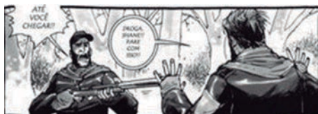
Figura 6- revista The Walking Dead , edição número 12, Kirkman, 2003.

Para que os episódios televisivos não se tornem previsíveis, variações da trama são construídas, e as mesmas situações têm desfechos diferentes da história em quadrinho. Isso contribui para uma ligação mais complexa entre a imagem da narrativa escrita e a imagem da série televisiva. Essa ligação não se dá apenas por raccord e continuidade, mas também por descontinuidade, desorientação e ambiguidade. O choque entre as duas variações da trama produz novos nexos, o que torna a percepção da obra muito mais sofisticada do que uma série que é transmitida apenas por um canal.