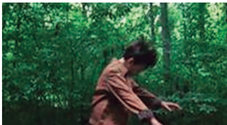
Figura 9- série The Walking Dead temporada 2, episódio 1, Kirkman e Darabont, 2011.

Ná história em quadrinhos, no fim do primeiro arco, quando Rick, Shane e Carl vão para a floresta, Carl mata Shane para proteger o pai. Na televisão, quando há a mesma situação, no primeiro episódio da segunda temporada, espera-se que Carl vá matar Shane, mas é Carl quem recebe uma bala perdida e quase morre. A montagem da série televisiva leva o espectador a pensar que o mesmo desfecho da história em quadrinhos irá acontecer. Porém, o que se vê na imagem é o garoto baleado, e não o personagem Shane. No universo de TWD, a imagem de Carl baleado justaposta à imagem de Shane morto cria um novo sentido, como Kulechov aponta. Porém, a incoerência narrativa aproxima a montagem transmídia de TWD à estrutura da Versão de Oposição defendida por Noel Burch.