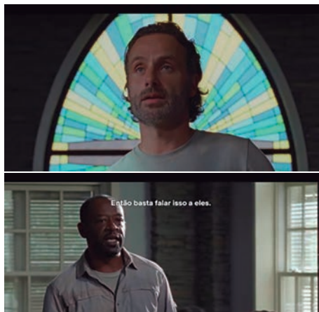
Figura 1,2 e 3- Fotogramas retirados da série The Walking Dead (KIRKMAN, DARABONT, 2010)

Para contar um diálogo entre o personagem Rick e o personagem Morgan, o diretor recorta o espaço da igreja e isola cada personagem no quadro. Ao combinar a imagem de Rick olhando da direita para a esquerda com a imagem de Morgan olhando da esquerda para a direita, a montagem estabelece uma relação entre os personagens independente da fala. É possível afirmar que nesse jogo o espectador pode assumir os olhos de Rick Grimes, já que a imagem de Morgan corresponde ao ponto de vista do protagonista.