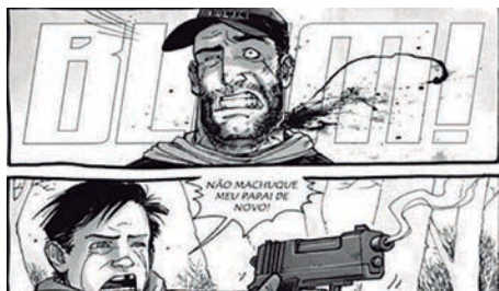
Figura 7- revista The Walking Dead , edição número 12, Kirkman, 2003.