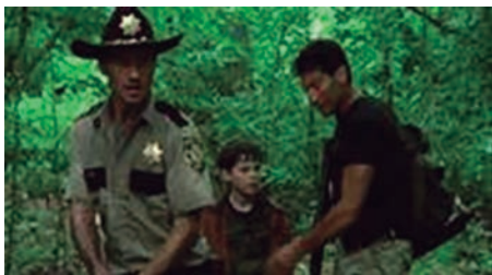
Figura 8- série The Walking Dead temporada 2, episódio 1, Kirkman e Darabont, 2011.