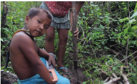
Figura 3 - Menino Ka'apor ajuda a arrancar mandiocaba para a 'festa inventada'.