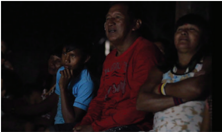
Figura 2 - A plateia atenta assiste a Mostra de Cinema Indígena na Ohú.

novidade, é realmente fascinante. A seguir alguns frames do filme que está sendo finalizado.