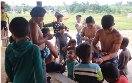
Figura 4 - Hora da pintura corporal feita com urucum. Sua cultura sendo repensada.