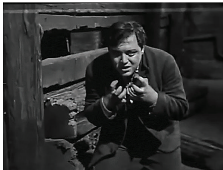
Figura 21 - Fotograma de M – o vampiro de Düsseldorf ( M – Eine Stadt sucht einen Mörder , 1931) dirigido por Fritz Lang.

a moderna palavra demônio deriva da noção grega clássica do daimon , que oferece a base para o seu modelo mitológico do daemônico 22 : "O daemônico é qualquer função natural que tenha o poder de dominar toda a pessoa. Por exemplo, sexo e erotismo, raiva e fúria ou o desejo de poder. O daemônico tanto pode ser criativo como destrutivo, e geralmente é ambos. Quando essa força se descontrola e um elemento usurpa o controle sobre a personalidade como um todo, temos a 'possessão pelo daimon ', o nome tradicional para a psicose ao longo da História (apud DIAMOND, 1994, p. 205).