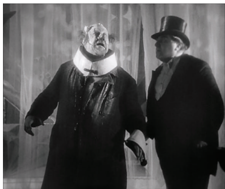
Figura 16 - Fotograma do filme O anjo azul ( Der blaue Engel , 1930) de Josef von Sternberg.

Nessa cena, Rath se apresenta ao público (figura 16) com o rosto pintado de palhaço e usando o sobretudo e o chapéu que vestia quando era professor, ele é uma caricatura do homem que algum dia foi. O mago começa a fazer vários truques, como tirar pombas do chapéu do professor e ovos do seu nariz, porém ousa até mesmo quebrar os ovos na testa do infeliz. Nesse transe repugnante, o algoz ainda exige que o protagonista cante como um galo. Nesse momento, atrás do palco, Lola beija um amante, traindo descaradamente a seu marido que observa do palco esta ação. Assim, nessa insuportável situação, dominado pela loucura, "Rath lança um grito desgarrador que gela o sangue dos assistentes, um quiquiriqui animal, não o canto solicitado, farsesco, senão um uivo nos limites do humano" 18 (SANCHEZ-BIOSCA, 190, p. 435).