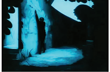
Figura 2 - Fotografia do filme O Gabinete do Dr. Caligari ( Das Kabinett des Dr. Caligari , 1919) dirigido por Robert Wiene.

personagens brotam da escuridão, que é "uma reserva, um lugar próprio do pictórico, sobre o qual podem se alçar, ou do qual podem provir as figuras" (AUMONT, 2014, p. 91). Assim como no filme O Gabinete do doutor Caligari , o sonâmbulo Cesare emerge das trevas como uma sombra estilizada para cometer um crime (Figura 2). Diante da plasticidade desse plano, "temos a sensação de ver uma poça preta, um corpo que é puro derrame de preto, que carrega consigo a noite que o circunda e também a pintura do cenário" 6 (AUMONT, 2014, p. 92).