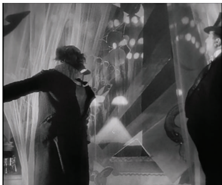
Figura 17 - Fotograma do filme O anjo azul ( Der blaue Engel , 1930) de Josef von Sternberg.

No degradante espetáculo imposto ao professor, ovos e canto compõem uma experiência dolorosa. O professor se mexe pelo cenário até ser coberto por uma sombra cinzelada por uma contraluz (figura 17). Destarte, tanto os elementos fílmicos como sonoros expressam desespero: o verdadeiro passe de mágica foi desumanizar o personagem até que ele se transformasse num animal desesperado, que expressa sua dor por meio de um grito desumano que entra na esfera do sinistro. O elemento sonoro, a sombra e os demais elementos fílmicos criam uma cena inesquecível que chega ao mais profundo da alma.