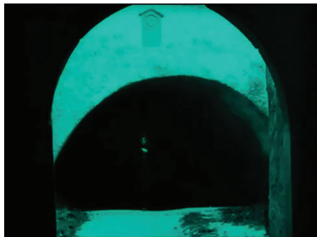
Figura 3 - Fotograma do filme Nosferatu (Nosferatu, Eine Symphonie des Grauens, 1922) , dirigido por F. W. Murnau.

“todos os locais escuros e matriciais [...] são locais de sofrimento e infelicidade, habitados por monstros [...] a obscuridade faz da caverna uma prisão, um lugar de punição e tortura, um sepulcro ou um verdadeiro inferno” (PASTOUREAU, 2011, p. 20).