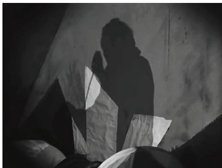
Figura 6 - Fotograma do filme O Gabinete do Dr. Caligari (Das Kabinett des Dr. Caligari, 1919) , dirigido por Robert Wiene. Fonte: Filme O Gabinete do Dr. Caligari (Das Kabinett des Dr. Caligari, 1919) , dirigido por Robert Wiene