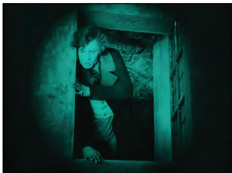
Figura 10 - Fotograma do filme Nosferatu (Nosferatu, Eine Symphonie des Grauens, 1922) , dirigido por F. W. Murnau. Fonte: Filme Nosferatu (Nosferatu, Eine Symphonie des Grauens, 1922) , dirigido por F. W. Murnau.

Por outro lado, em outra cena, Hutter, após descobrir a verdadeira identidade do seu anfitrião, assombrado, observa o vampiro abandonar o castelo a uma velocidade antinatural. Entretanto, uma densa camada de sombra circular rodeia esse plano (figura 10). Dessa forma, as camadas de sombra contribuem para criar uma atmosfera sinistra na mise-en-scène e aumentar a tensão dramática.