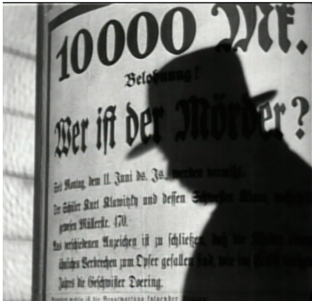
Figura 18 - Fotografia de M – o vampiro de Düsseldorf ( M – Eine Stadt sucht einen Mörder , 1931) dirigido por Fritz Lang. Fonte: M – o vampiro de Düsseldorf ( M – Eine Stadt sucht einen Mörder , 1931) dirigido por Fritz Lang.

Assim, as forças escuras que transformam esse indivíduo num monstro que, em estado delirante comete crimes execráveis, se condensam naquela silhueta do perfil do protagonista que evoca as skiagraphias lavaterianas.