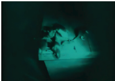
Figura 12 - Fotograma do filme Nosferatu (Nosferatu, Eine Symphonie des Grauens, 1922) , dirigido por F. W. Murnau. Fonte: Filme Nosferatu (Nosferatu, Eine Symphonie des Grauens, 1922) , dirigido por F. W. Murnau.

Essa ameaça iminente encontra-se em vários planos, como, por exemplo: na abertura da íris, no plano do veleiro Empusa 14 que transporta o vampiro e seus caixões rumo a Wisborg, no contraste entre a luz e a sombra que extrai das trevas os ratos (figura 12) e na camada de sombra ao redor do plano do marujo aterrizado pelo vampiro (figura 13), entre outros.