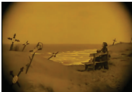
Figura 11 - Fotograma do filme Nosferatu (Nosferatu, Eine Symphonie des Grauens, 1922) , dirigido por F. W. Murnau. Fonte: Filme Nosferatu (Nosferatu, Eine Symphonie des Grauens, 1922) , dirigido por F. W. Murnau.

Na cena seguinte, que inicia com uma abertura da íris que deixa uma camada de sombra ao redor do plano, Ellen, vestida de negro, espera frente ao mar o retorno do marido (figura 11) 12 , as camadas de sombras e os elementos fílmicos estão contaminados pela presença do vampiro. Nesses elementos estilísticos se encontra uma “ameaça iminente, porém oculta” (BOUVIER & LEUTRAT apud AUMONT, 1990, p. 198). Assim, “Ellen se situa na fronteira entre as ondas representantes da ameaça mortal, e a terra da qual surgirão seus amigos” 13 (BOUVIER & LEUTRAT apud AUMONT, 1990, p. 195).