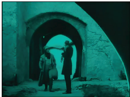
Figura 4 - Fotograma do filme Nosferatu (Nosferatu, Eine Symphonie des Grauens, 1922) , dirigido por F. W. Murnau. Fonte: Filme Nosferatu (Nosferatu, Eine Symphonie des Grauens, 1922) , dirigido por F. W. Murnau.

Nosferatu, vestido de preto, caminha de maneira estilizada até se posicionar na área central do enquadramento. Hutter, o corredor de imóveis, atravessa outro umbral até se encontrar com o vampiro. A composição desse plano dá destaque, no canto superior direito, a uma sombria forma circular que tem um fino contorno luminoso (Figura 4). O uso desse tipo de elementos fílmicos no lugar dos catches pretos é recorrente na mise-en-scène das seqüências do castelo.