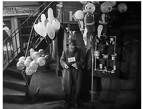
Figura 19 - Fotografia de M – o vampiro de Düsseldorf ( M – Eine Stadt sucht einen Mörder , 1931) dirigido por Fritz Lang. Fonte: M – o vampiro de Düsseldorf ( M – Eine Stadt sucht einen Mörder , 1931) dirigido por Fritz Lang.