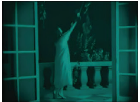
Figura 15 - Fotogramas do filme Nosferatu ( Nosferatu, Eine Symphonie des Grauens , 1922), dirigido por F. W. Murnau. Fonte: Filme Nosferatu ( Nosferatu, Eine Symphonie des Grauens , 1922), dirigido por F. W. Murnau.

Murnau usa as camadas de sombra nesses planos para sugerir a ameaça do vampiro. Essa sequência é acompanhada pelo som de uma música orquestral que aumenta a tensão dramática, mas não substitui o som diégético 16 do vento, evocado pelo movimento dos elementos fílmicos na mise-en-scène .