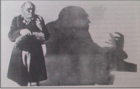
Figura 7 - Fotograma do filme O Gabinete do Dr. Caligari , 1919. Fonte: O Gabinete do Dr. Caligari , 1919, dirigido por Robert Wiene. Alemanha (apud STOICHITA, 1999, p. 155).

o elemento principal da mise-en-scène expressionista, e o recurso mais explorado por este movimento cinematográfico (AUMONT, 2014, p. 92).