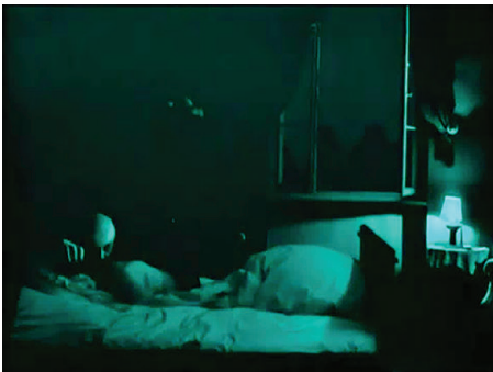
Figura 1 - Fotografia do filme Nosferatu , uma sinfonia do horror ( Nosferatu, Eine Symphonie des Grauens ), 1922, Dir. F. W. Murnau.

Influenciado pelo estilo claro-escuro, chamado de tenebroso (escuro) desenvolvido na arte pictórica pelo mestre italiano Michelangelo Merisi, conhecido como Caravaggio, (GOMBRICH, 1995, p. 393); o cinema expressionista explorará o contraste entre a luz e a sombra para destacar os elementos fílmicos de sua mise-en-scène . Podemos observar isso na última cena de Nosferatu (figura 1), a qual é iluminada por uma lâmpada localizada no lado direito do quadro cuja luz se reflete nos objetos de cor branca, como o lençol da cama, a camisola de Ellen e a cabeça do vampiro, o qual está sugando o sangue de sua vítima. Esses elementos narrativos e estilísticos 5 são indícios que permitem deduzir a ação que acontece na cena sem que seja necessário assistir a todo o filme. A camisola alva de Ellen representa a pureza dessa personagem que é profanada pelo vampiro nas horas noturnas. A direção da iluminação ressalta a mão direita do vilão. Pelo contraste entre a luz e a sombra, ela se assemelha a uma garra que, junto com a cabeça, emerge das trevas. Mimetizado por causa da tonalidade escura das vestes, o corpo do vampiro parece fazer parte dessa escuridão. Por conseguinte, tem-se a impressão de que o ente maldito nasce da sombra que, como formula o pesquisador do demoníaco na arte Enrico Castelli, "a sombra oculta o monstro" (CASTELLI, 2007, p. 155).