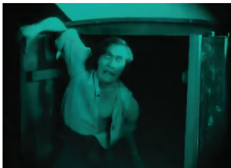
Figura 13 - Fotograma do filme Nosferatu (Nosferatu, Eine Symphonie des Grauens, 1922) , dirigido por F. W. Murnau.