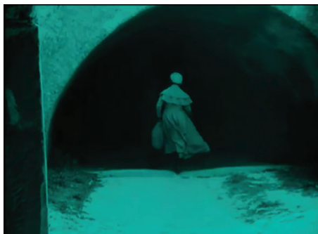
Figura 5 - Fotograma do filme Nosferatu (Nosferatu, Eine Symphonie des Grauens, 1922) , dirigido por F. W. Murnau.

Hutter segue Nosferatu pelo interior do túnel (figura 5), naquele fundo preto, até se dissolver na cor das trevas e da noite, na cor das entranhas da terra, do mundo subterrâneo e também da morte (PASTOUREAU, 2011, p. 28).