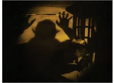
Figura 8 - Fotograma do filme Nosferatu (Nosferatu, Eine Symphonie des Grauens, 1922) , dirigido por F. W. Murnau.

Por outro lado, no filme Nosferatu , a sombra grotesca que o vampiro projeta (figura 8) é o próprio monstro. Nosferatu não dispõe de silhueta, pois, como recorda Stoichita, “segundo uma antiga tradição os vampiros carecem de sombra” (1999, p. 157); mas ele próprio é a sombra que paira sobre Hutter. Esse ente maligno, assim como o diabo 9 , não possui uma sombra, mas ataca suas vítimas, utilizando artifícios sobrenaturais. Ressaltamos que para o oculista Albin Grau, diretor artístico e produtor do filme, as sombras fazem visíveis as forças invisíveis e escuras, “o outro lado” 10 .