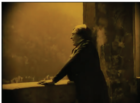
Figura 9 - Fotograma do filme Nosferatu (Nosferatu, Eine Symphonie des Grauens, 1922) , dirigido por F. W. Murnau. Fonte: Filme Nosferatu (Nosferatu, Eine Symphonie des Grauens, 1922) , dirigido por F. W. Murnau.

Por outro lado, em outra cena, Hutter, após descobrir a verdadeira identidade do seu anfitrião, assombrado, observa o vampiro abandonar o castelo a uma velocidade antinatural. Entretanto, uma densa camada de sombra circular rodeia esse plano (figura 10). Dessa forma, as camadas de sombra contribuem para criar uma atmosfera sinistra na mise-en-scène e aumentar a tensão dramática.