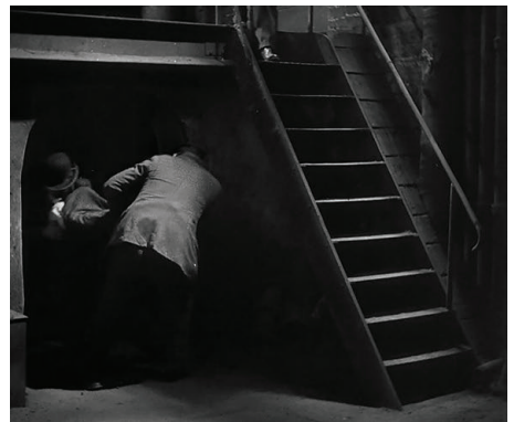
Figura 20 - Fotografia de M – o vampiro de Düsseldorf ( M – Eine Stadt sucht einen Mörder , 1931) dirigido por Fritz Lang.

Esse ancião, que reconhece o assobio do assassino, informa a um dos criminosos a localização de Beckert. Este homem escreve com giz a letra “M” de assassino ( mörder ) na palma da mão e marca o infantícia nas costas, sem que este perceba que foi descoberto e que os delinquentes seguem esse sinal. O assassino finalmente é capturado e levado a um prédio em ruínas. Nesse lugar, dois criminosos o tiram de um espaço coberto de trevas (figura 20) que evoca a sombra da qual emergem os personagens expressionistas (figuras 2 e 3). E o inferno, um lugar escuro e subterrâneo.