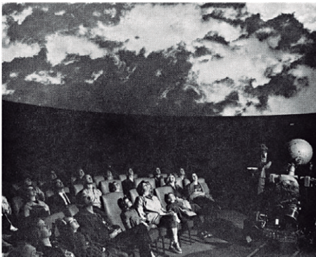
Figura 3 - Exibição de time-lapse no interior do Atmospherium-Planetarium.

Outro destaque, neste contexto, foi a iniciativa pioneira de produção de filmes com objetivas fisheye por Wendall A. Mordy, físico atmosférico que observou a pouca atenção conferida nos planetários aos fenômenos atmosféricos que aconteciam à luz do dia, em favor do céu noturno. No período em que dirigiu a equipe do Fleischmann Atmospherium-Planetarium , na University of Nevada-Reno , Mordy criou uma série de conteúdos explorando a cinegrafia fisheye que incluíam time-lapses de formações de nuvens, fenômenos atmosféricos, simulações de viagens pelo sistema solar, o lançamento do satélite Saturn I e até mesmo tomadas subaquáticas no Havaí. Inaugurado em 1963, o Atmospherium-Planetarium contava, além de um projetor óptico-mecânico Spitz , também com um projetor de filmes 35mm adaptado com uma lente fisheye , sendo considerado a primeira instituição a integrar demonstrações dos fenômenos atmosféricos com os programas astronômicos tradicionais (Imagem 03). Apesar do sucesso de público e das possibilidades abertas, a iniciativa de produção audiovisual fisheye permaneceu isolada na comunidade de planetários naquele momento e não houve replicação, já que os filmes eram escassos e sua produção exigia conhecimentos e equipamentos radicalmente distintos dos usuais nos demais planetários (Marche 2005, p.145).