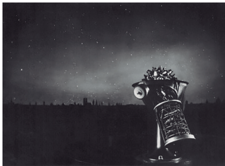
Figura 2 - Primeiro planetário Zeiss Model I, Deutsches Museum, 1925.

Em 1923, o primeiro planetário por projeção foi instalado em Munique, na Alemanha. Desde 1905, Oskar von Miller, fundador e diretor do Deutsches Museum, intencionava a construção de dispositivos que pudessem enriquecer o espaço dedicado à astronomia na instituição. Nesse sentido, se aproximou da companhia de sistemas ópticos Carl Zeiss e negociou a construção de um modelo no estilo "esfera oca". Walter Bauersfeld, engenheiro da Zeiss responsável pelo projeto, concebeu o dispositivo como uma grande semiesfera fixa em cuja superfície interna as estrelas e demais objetos celestes seriam representados por meio de projeção luminosa viabilizada por um conjunto de pequenos projetores situados no interior da sala. Assim, em 1919 iniciou-se a construção do projetor Zeiss Model I, com capacidade para projetar um total de 4500 estrelas, os planetas, o sol e a lua. No caso dos planetas maiores e estrelas de maior magnitude, eram empregados diapositivos que então projetavam os corpos celestes na parte interna do domo (King 1978, 344). Outros quarenta e um projetores formavam a mancha difusa da Via-Láctea e os nomes das constelações, sendo que o movimento dos diversos elementos era engenhosamente interconectado e sincronizado, mantendo-se as posições relativas entre eles (Chartrand 1973, 97).