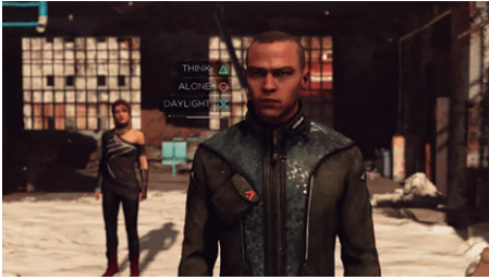
Figura 2: Tela de escolhas Detroit (2018). Divulgação Quantic Dream.

Observando a interatividade e a narrativa, podemos perceber uma construção parecida com a concepção de Manovich (2007) com a “interatividade arbórea” (ou como exibido pelo próprio jogo em forma de diagrama), mas talvez podemos pensar em uma construção parecida com uma fórmula dodecaedro, onde os pontos formados pela união das linhas são um pequeno mundo de funções a serem desempenhadas (pintar um quadro, tocar piano, ler algumas revistas...) mas em algum momento precisa-se tomar decisões para que leve a outros pontos e assim adiante. Havendo a possibilidade de sempre recomeçar ou parar.