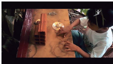
Figura 3 - Imagem do filme "Cordilheira de Amoras II" da diretora Jamilie Fortunato – Computador imaginário

A casa de tijolos possui televisão e computador que na realidade são cds, caixas de sabão em pó que foram jogados no lixo. Nesse momento não se sabe o que eles estão vendo no computador ou na televisão, simplesmente pegam o controle e ligam.