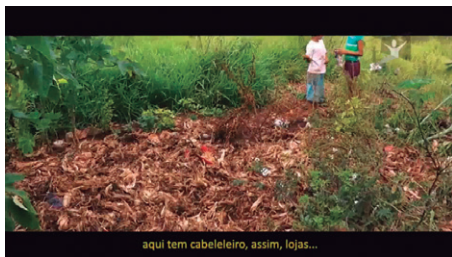
Figura 6 - Imagem do filme "Cordilheira de Amoras II" da diretora Jamilie Fortunato – O shopping imaginário

Além de sua casa, a índia Carine mostra o seu Shopping composto por cabelereiro, lojas, comidas, doces e Champanhe. Segundo s sua mãe "é tudo lixo" porém para ela é o "meu Shopping!".