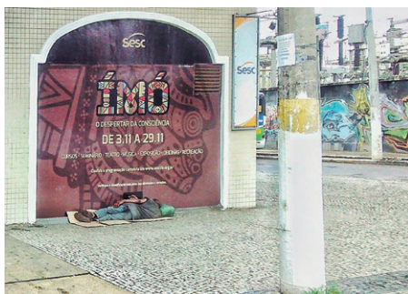
Figura 7 – Fotografia do Invisível – Aluna Bruna Pereira e a foto do invisível social

A fotografia do invisível é revelada nas fotos através do olhar do indivíduo e também dos acasos seja da fotografia ou da deriva. Podemos ver através dessas três fotos, como o invisível é representado, porém somente com uma intertextualidade é possível percebê-lo.