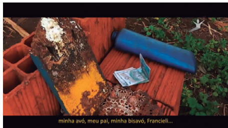
Figura 2 - Imagem do filme "Cordilheira de Amoras II" da diretora Jamilie Fortunato – Foto invisível dos amigos e familiares

No começo do filme, a índia Carine exibe uma fotografia invisível de suas colegas e também de sua família. Essas fotos estão em isopor sujo e velho, localizados em cima de um conjunto de tijolos. O invisível está também na construção simbólica de uma casa que possui fotos de familiares e amigos em uma estante.