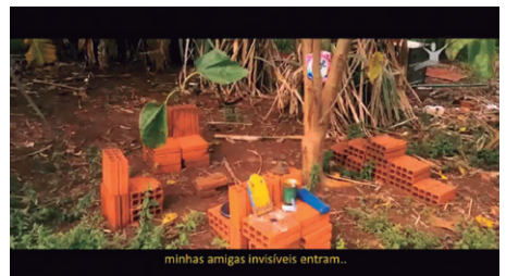
Figura 1 - Imagem do filme “Cordilheira de Amoras II” da diretora Jamille Fortunato – Casa de Tijolo

A índia Carine expressa seu desejo de voltar para casa antiga através da sua amiga invisível Francielle mas a resposta relatada através da fala da mãe é que a casa “já tem outro dono”. Como não podem voltar para sua antiga casa, Carine resolve construir sua própria casa através de tijolos comprado pela família. O importante observar é a construção da casa imaginária feita a partir da representação da sua experiência de mundo ocidental, urbano e capitalista.