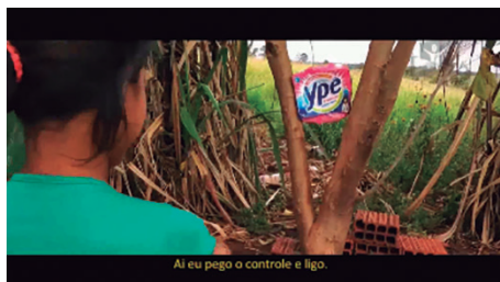
Figura 4 - Imagem do filme "Cordilheira de Amoras II" da diretora Jamilie Fortunato – Televisão imaginária

Seu imaginário construído envolve desde o desejo da casa própria, com televisão e computador até histórias em quadrinhos europeias, como a Chapeuzinho Vermelho, lidas em catálogos e revistas que vendem objetos de moda.