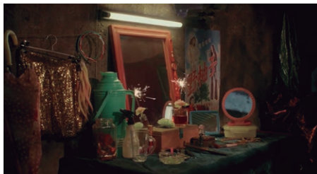
Figure 3 – le feu d'artifice d'« une minute » (Bi Gan 2019)

Quelqu'un qui est parti sûrement reviendra Et remplira d'amour un panier de bambou vide Sûrement il y aura quelque écroulement d'argile Et quelque vallée s'ouvrira comme une main (Kaili Blues 2016).