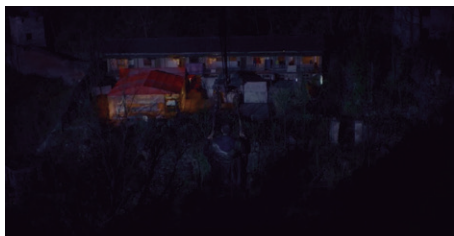
Figure 1 – un saut dans la mémoire-Être (Bi Gan 2019)

Le titre du film emprunté à Eugene O'Neill — Long Day's Journey into Night — revêt alors avec ce plan-séquence un sens singulier, faisant apparaître sous l'histoire actuelle du présent l'histoire virtuelle « qui ne peut être racontée qu'au passé » : c'est le voyage interne de Luo qui remonte, à partir du solstice d'été — le jour où il capture Wan Qiwan, le jour où toute recherche de la mémoire commence et ne cesse depuis lors de se relancer —, jusqu'au solstice d'hiver — la temporalité dans la mine souterraine, ce tréfonds nébuleux le plus secret de son passé : « Une disparue : à chaque fois que je me sens prêt à l'oublier, elle revient dans mon rêve. » C'est comme si la caméra, par ses mouvements traînants de descente, traçait, d'un cercle à l'autre, le souvenir le plus récent de Luo (l'enfant qu'il aurait pu avoir qui joue au ping-pong) jusqu'à son souvenir d'enfance (sa mère disparue avec les cheveux rouges), et effectue par là même une plongée vertigineuse vers la base-limite du cône bergsonien renversé, une expansion infinie de la mémoire en cercles concentriques mais toujours plus excentrés, et cela jusqu'à son « enveloppe extrême », le plan le plus dilaté du « passé pur » AB, la Mémoire ontologique de toute son existence passée : « Nous sommes construits en mémoire, nous sommes à la fois l'enfance, l'adolescence, la vieillesse et la maturité » (Deleuze 1985, 130). 13