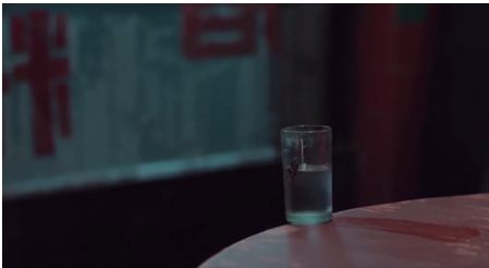
Figure 2 - L'« image-cristal » tarkovskienne (Bi Gan 2019)

L'image-cristal a ces deux aspects : limite intérieure de tous les circuits relatifs, mais aussi enveloppe ultime, variable, réformable, aux confins du monde, au-delà même des mouvements du monde. Le petit germe cristallin et l'immense univers cristallisable (Deleuze 1985, 108).