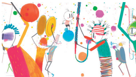
Figura 4 - O festejo popular.

Se tentarmos apontar alguma similaridade com os festejos brasileiros ou latino-americanos, podemos ver bastante semelhanças com uma festa popular específica, católica e interpretada como parte do folclore brasileiro, a Folia de Reis 3 . Nesta manifestação, o grupo de foliões sai numa jornada de horas e interagem com os moradores por onde passam estabelecendo os ritos que fazem parte dessa folia, sem no entanto atrapalhar o processo (Paulino 2010). Vemos esta semelhança com a Folia de Reis , quando o Menino interage com o grupo de forma que não abala o seu rito.