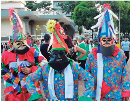
Figura 5 - Foliões na Folia de Reis .

Voltando na questão simbólica, na Folia de Reis (figura 5) observamos alguns ícones parecidos presentes nos manifestantes presentes em O Menino e o Mundo (figura4), as máscaras e os chapéus em formato de cones estão presentes no grupo de festa do filme. Tratando-se especificamente da máscara, já é da natureza da animação o caráter simbólico e lúdico, principalmente quando quer tratar de temas reais em linguagem intencionalmente metafórica, com o objeto máscara não seria diferente. Os personagens são construídos em linguagem simbólica e ainda estão mascarados, conferindo mais mistério e espaço à imaginação do público/audiência.