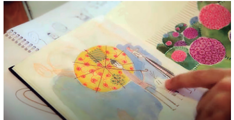
Figura 1 - Diário visual e anotações do Diretor Alê Abreu

da cena, certa interação entre um espaço, uma ação, um ator e um tempo, além da habilidade para a manipulação das qualidades e possibilidades intermediadoras da câmera. (Conde 2014, 160)