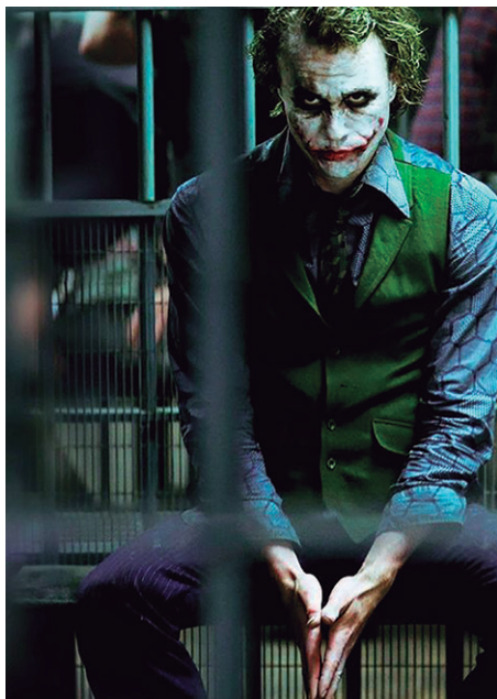
Figura 6 - Heath Ledger em The Dark Knight (2008)

Walter Benjamin refere que «(...) à medida que restringe o papel da aura, o cinema constrói artificialmente, fora de estúdio, a “personalidade” do ator: o culto da “estrela”, que favorece o capitalismo dos produtores cinematográficos, protege essa magia da personalidade, que há muito já está reduzida ao encanto podre do seu valor mercantil» (2018, p.239). Ora, de facto, por um lado existe esta condição de que toda a vida do ator é idealizada pelo seu público através das personagens que já interpretou, e em torno disso existe uma realidade económica e capitalista inerente a essas construções. Por outro lado, essas personagens contribuíram de facto para a sua construção identitária profissional, integrando o respetivo ator numa categoria cinematográfica específica. Isto, por sua vez, remete para uma preferência pessoal do ator em colaborar nesse tipo de projetos. Essas escolhas têm que ver com diversos fatores, nomeadamente necessidades financeiras, vontade de explorar novas vertentes, etc. Mas todas essas decisões remetem para o interior do próprio ator. São de ímpeto pessoal, e dessa forma contribuem para a sua construção enquanto pessoa. No que diz respeito às personagens em si, também elas de certa forma contribuem para essa construção, como veremos no seguimento deste subtema.