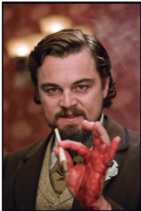
Figura 3 - Leonardo DiCaprio em Django Unchained (2012) Disponível em: https://www.pinterest.pt/pin/18507048457790282/

O ator está presente, numa encenação que por vezes torna a ficção real, quando esta não é simulada pelo pano verde. Essa presença e essa ficção tangível podem tornar inteligível a distinção entre o real e a ficção, na medida em que a imersão a que se submetem conduz à representação de algo que, naquele momento, está de facto a acontecer. Por exemplo, no filme Django Unchained (2012), de Quentin Tarantino, na cena da sala de jantar, Leonardo DiCaprio, que representava Calvin Candie, cortou acidentalmente a mão durante a representação e continuou a sua interpretação, deixando que o plano real (o corte) se dissolvesse na ficção (o filme) de maneira a que daí resultasse uma experiência complementar entre esses planos, cuja ponte é o ator. A imersão é de tal forma vivida que para tornar a ficção o mais real possível, o ator não abdicou da representação para colocar a sua dor em primeiro plano. Aliás, esse acidente contribuiu ainda mais para uma construção autêntica da cena.