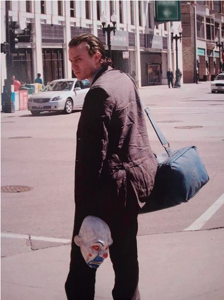
Figura 1 - Heath Ledger em The Dark Knight (2008) Disponível em: https://www.pinterest.pt/pin/758012181023806817/

A construção e a organização dessas experiências vão marcar o ator conforme a sua permissão. Realmente, se se comparar a personagem ao outro , ambos são indivíduos distintos do ator e dessa forma, é possível afirmar que as personagens que ele representa contribuem para a construção da sua própria identidade, da mesma forma que o outro contribui. Cabe ao ator decidir e refletir sobre si mesmo, de modo a permitir com que intensidade é que isso o vai condicionar a si e à sua essência. O ator, mais que a grande mancha social, tem a capacidade aprimorada de se colocar na pele do outro, o que torna a sua existência mais flexível e expandida, na medida em que explora diversas vertentes e realidades. Ele tem o privilégio de delimitar as suas próprias fronteiras conscientemente, tendo conhecimento de que a sua personagem é ou não parte integrante de si. Ele sabe distinguir, e é nesse sentido que o seu autoconhecimento é fundamental, na medida em que dessa forma não permite que o seu trabalho interfira com a sua autenticidade. Porque é a partir dessa autenticidade que ele consegue expressar outras personagens.