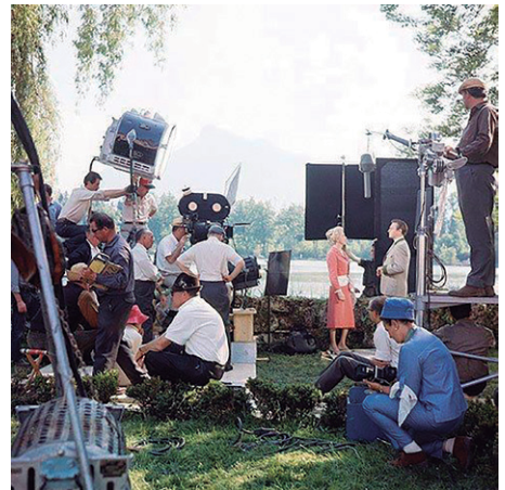
Figura 2 - Por trás das câmaras do filme The Sound Of Music (1965). Disponível em: https://www.pinterest.pt/pin/78672324729888868/

A distinção entre a realidade e a ficção torna-se um exercício enigmático e desafiador na construção cinematográfica. A montagem de um filme passa por um processo que envolve diversos setores, tais como a escrita do guião, o casting para a escolha das personagens, a encenação, e toda a equipa tem uma função essencial para que o filme aconteça, desde o empregado do coffee break ao realizador. Existe um empenho e uma dedicação para que tudo aconteça e principalmente para que a ficção passe a ser realidade. Por ficção não me refiro aos filmes desse gênero , mas sim a tudo o que faça parte do outro plano para lá do real, onde as histórias existem apenas no plano imaginário de quem as cria, sem ainda terem sido submetidas à concretização.