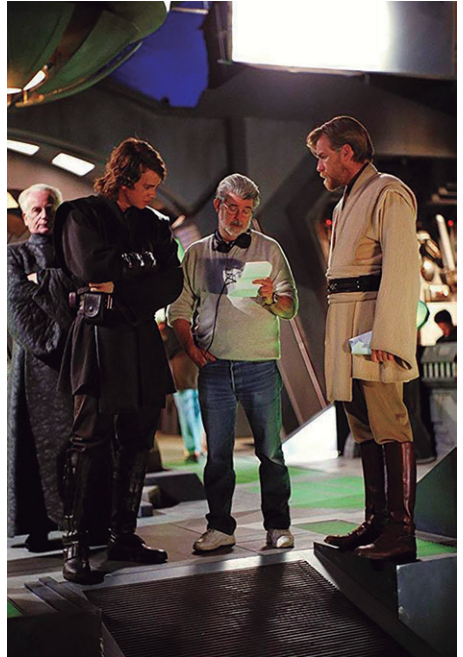
Figura 5 - Por trás das câmaras de Star Wars: Episode III - Revenge of the Sith (2005)

A estranheza com que o ator de cinema encara, por vezes, a sua personagem, remete para a familiaridade com que ambos se identificam. Essa sensação convoca, mais uma vez, a questão da identificação pessoal perante o outro , com a diferença de que, agora, esse outro é transportado para a primeira pessoa e, posteriormente, para o público.