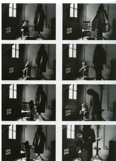
Figura 3: Série “The spirit leaves de body” de Duane Michals.