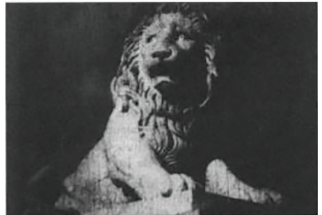
Figura 5: Fonte: “A forma do filme” (2002). Exemplo de movimento artificialmente criado e geração de sentido por justaposição.

Mais tardiamente Eisenstein aponta também para a importância do que chama de “Montagem Vertical”, que consiste em pensar a composição, ou montagem, dos elementos internos e simultâneos ao plano. Ou seja, percebe a importância da narrativa interna de cada plano e seu potencial discursivo. Nesse ponto sua teoria se aproxima no que já falamos a cima acerca do potencial narrativo de cada fotografia individualmente. Leone e Mourão destacam que nessa fase: