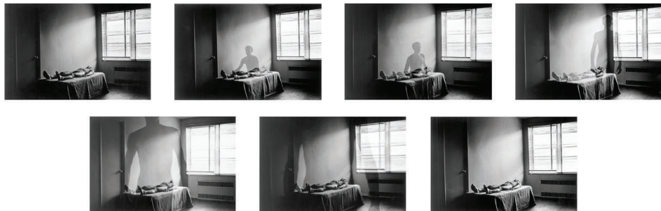
Figura 2: Série “The spirit leaves de body” de Duane Michals.