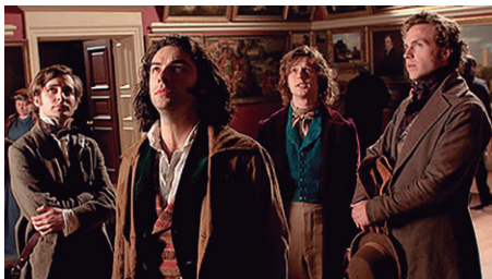
Fig. 7. Fotograma de la Serie: Desperate Romantics (2009).

Se trata de una miniserie de 6 episodios, en la que un grupo de jóvenes pintores y poetas, la Hermanidad Prerrafaelita , pretende revolucionar el mundo del arte para siempre. Millais, Hunt y Rosetti son los miembros fundadores de la Hermandad, cuyo valedor y mecenas será el encumbrado crítico de arte John Ruskin, que incluso llegará a defenderlos en público ante los ataques de Charles Dickens. Excesos, irreverencia, vidas disipadas para la moral de la época, enfrentamientos con el establishment y la puja constante por el reconocimiento forman parte de la trama.