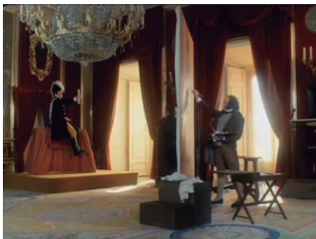
Fig. 6. Fotograma de la Serie: Goya (1985).

Con el tercer episodio: Cayetana , emerge con gran fuerza una figura femenina de la que se cree tuvo gran influencia en Goya, no solo en el apartado artístico sino también en el personal, se trata de la Duquesa de Alba, de la que se dice, que, al enviudar pudo tener un romance con el pintor.