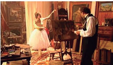
Fig. 8. Fotograma de la Serie: The Impressionists (2006).

La historia nos presenta a un Monet que sigue interactuando con su incipiente arte y su interés en ser reconocido por el Salón , y lo consigue a partir de la obra Camille con traje verde (1866), el cual, al no ser muy popular, es confundido con Manet, entrando éste en cólera tras ser felicitado por una obra que no es suya, posteriormente, tras conocerse ambos artistas, se entablará una gran amistad.