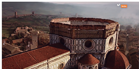
Fig. 3. Fotograma de la Serie: Los Medici. Señores de Florencia (2016).

Una de las obras de arte, a la que se hace especial mención en la primera temporada, será la cúpula de la Catedral de Santa María del Fiore , que tras sesudos proyectos por estudiosos de la época, el proyecto fue a parar a Filippo Brunelleschi (1420); esta empresa, se convertirá en el sueño y la obsesión de Cosme de Medici; destaca, igualmente, una magnífica banda sonora. También habrá lugar para mostrar la escultura del «Quattrocento», donde la principal figura será Donatello y su célebre obra, David (1440).