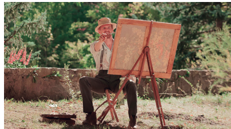
Fig. 10. Fotograma de la Serie: El legado de Van Gogh (2013).