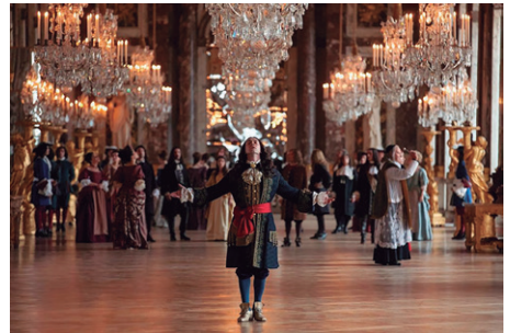
Fig. 5. Fotograma de la Serie: Versalles (2015).

La serie nos presenta la realidad de Versalles en toda su inmensidad, que va desde lo político hasta lo privado. Por ello, trascendiendo más allá de lo meramente artístico, nos brinda la posibilidad de apreciar aspectos como el funcionamiento del mercantilismo, personificado en la figura de Colbert, así como la plasmación de los órdenes sociales del «Antiguo Régimen». Asimismo nos ofrece la visualización de la guerra contra los Países Bajos, que llevaría aparejada la persecución del orbe protestante. Igualmente, el contencioso con el Vaticano, como el problema de la sucesión al trono español comportarán para Luis XIV y para su corte verdaderos quebraderos de cabeza, mientras la medicina y la ciencia avanzan y superan viejos saberes a través del estudio y disección de cadáveres.