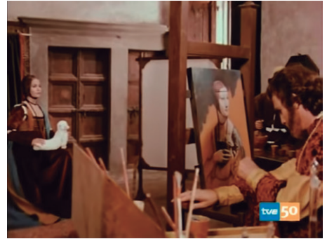
Fig. 2. Fotograma de la Serie: La vida de Leonardo da Vinci (1971).

de todos los personajes y la ambientación son sublimes y la forma de mostrarnos las imágenes está cuidada y dotada de gran hermosura.