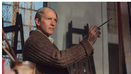
Fig. 12. Fotograma de la Serie: Genius Picasso (2018).

Esta miniserie —de 10 episodios— supone una brillante evocación a una de las personalidades artísticas más relevantes del siglo XX, y una gran contribución a la didáctica de la Historia del Arte como disciplina. De esta manera, percibimos que está dispuesta a modo de biopic , y a través de dos hilos temporales que se van intercalando a medida que se van cubriendo las etapas del artista.