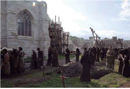
Fig. 1. Fotograma de la Serie: Los pilares de la Tierra (1985).

Así pues, se puede decir que todo comienza con un sueño: el de un humilde constructor llamado Tom, de levantar la catedral de Kingsbridge desde sus cimientos tras sufrir un grave incendio. Alrededor de la construcción se desarrolla una historia de amor, muerte, y lucha entre nobleza y clero en la Inglaterra de la Edad Media, en concreto en el siglo XII, durante un periodo de guerra civil conocido como la anarquía inglesa. A pesar de la complejidad de la obra, se presenta de manera solvente, pues los lugares están muy bien escogidos y la fotografía, es bellísima, lo que nos permite captar a la perfección la crudeza de la época.