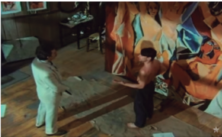
Fig. 11. Fotograma de la Serie: El joven Picasso (1994).

Recrea la juventud de Pablo Picasso (1881-1973) hasta el momento en que acaba su legendaria obra Las señoritas de Avignon . En el otoño de 1900, Picasso y su amigo Cassagemas llegan a la estación del Quai D'Orsay. Es el año de la gran Exposición Universal de París . Después de buscar alojamiento, visitan a Nonell, un pintor catalán amigo suyo, que los acompaña a la exposición y les proporciona compañía femenina (Germaine y Antoinette Gargallo). Cassagemas se siente atraído por Germaine, pero ésta coquetea furtivamente con Picasso. Un amigo de Nonell los lleva al Moulin Rouge , donde Picasso tiene la oportunidad de conocer a Toulouse Lautrec y también a su primer marchante. Cuando Nonell regresa a Barcelona, Cassagemas y Picasso se instalan en su estudio.