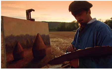
Fig. 9. Fotograma de la Serie: The Impressionists (2006).

Degas, de gustos más refinados, no siguió los pasos de Renoir o Monet; en su búsqueda de la verdad en una pintura a plain air , sino más bien, de una atmósfera más intimista, privada o incluso elitista. Por ello, en la serie se deja ver su predilección por ambientes ligados al ballet. Gustaba de cuidar el tema y de elegir muy bien los motivos, posiblemente heredero de sus propias costumbres refinadas, que sin embargo, nunca le impidieron trabar amistad con el resto de la terna impresionista. A este efecto podría servir la obra de Ensayo de ballet sobre el escenario (1874) o incluso, Clase de danza (1871), en sendas obras utilizaba con gran asiduidad, como modelos, a las propias bailarinas.