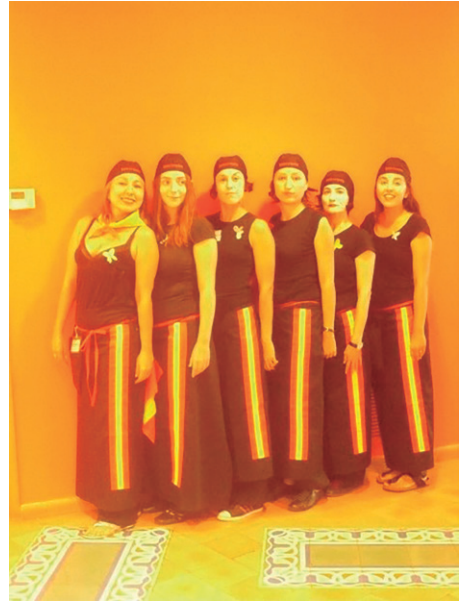
Fig.7: As participantes de "Baile Académico III".

Em 2009, em Barcelona, também durante um Congresso de Educação Artística, a performance "La amenaza (a ameaça). Baile Académico III". A performance foi assumida por um grupo de sete mulheres que em conjunto incubaram e realizaram a ação. Os parceiros eram alunos de doutoramento dos programas pré-Bolonha de Criatividade e Terapia Artística. Tinham desenvolvido um workshop conjunto sobre os medos e como encontrar recursos de criatividade e autoconhecimento que as pudesse proteger e servir como antídoto para enfrentar os medos, principalmente os irracionais. Para isso utilizaram a reconstrução de um ritual e desenvolveram um trabalho colaborativo no qual cada um dos participantes processou à sua maneira transformadora um processo comum em que se ligavam aos seus diferentes medos e ameaças.