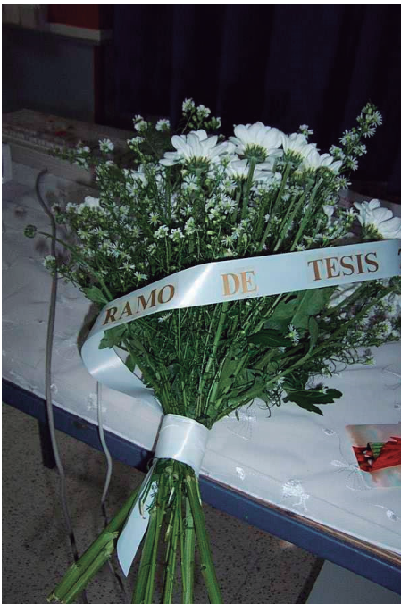
Fig. 3: Ramo da Tese da performance “Auto Boda”.

As artistas entendem que o campo académico tende a ser definido por uma certa rigidez nos protocolos, regulamentos, mesmo num mundo como o atual em que a perda dos rituais é evidente, mais notória em Espanha (país de origem das artistas) que em Portugal. Neste ponto, as artistas consideraram que talvez fosse um paradoxo realizar a performance em Beja, cidade de um país (Portugal) onde os rituais académicos têm valor e dignidade (quando comparados com Espanha). A performance planeada era assim transgressora, mas na mesma transgressão estava o respeito e a apreciação pela força dos rituais. Por outro lado, o congresso estaria cheio de espanhóis, e a própria performance também exigiu simbolicamente uma espécie de união dos “ibéricos” na valorização das diferenças.