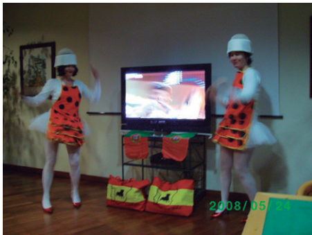
Fig. 12: Figurino completo da performance “Baile Académico I”.

Em “Baile Académico I”, Pilar e Arantxa escolheram o fato de bailarina clássica, com o maillot , o tutu, o casaco traçado e os sapatos clássicos de ballet , de forma a realçar a iconografia da performance. Ao experimentarem as roupas, as artistas vivenciaram uma sensação de estranheza, dado não terem os corpos características das bailarinas clássicas. O figurino foi complementado pelo chapéu de doutoramento, um avental de faraloes , uma mala com uma bandeira espanhola e um mapa ibérico com um touro. Para além disso, tinham uns sapatos de dança vermelhos brilhantes com tacão alto, que as artistas usavam apenas nos momentos mais “performativos” da interação. Estes sapatos vermelhos remetiam para o conto de fadas “Las zapatillas rojas” mas também a uma “piscadela” introduzida pelos sapatos vermelhos de dança, numa analogia ao comportamento académico viciante de acumular méritos académicos.