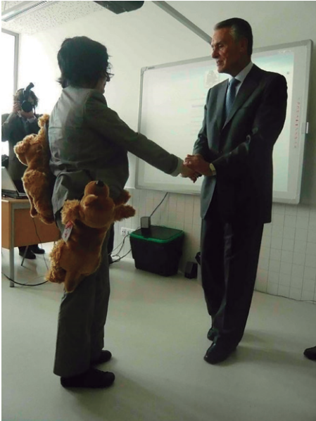
Fig 10. Pilar cumprimenta "formalmente" o Presidente da República Portuguesa, Prof. Anibal Cavaco Silva.

Este pedigree acadêmico (a raça de animais de peluche enfiados num cinto militar ornamentado) foi incorporado à performance longitudinal que culminou em todas os "bailes acadêmicos" e foi chamado de "Uniforme Posbolonio", acompanhando Pilar em alguns eventos e micro performances.