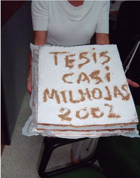
Fig. 2: O Bolo da Tese da performance “Auto Boda”.

tese. Esta performance foi a influência mais marcante para a série “Bailes Académicos”, pois já indicava uma orientação para a futura investigação.