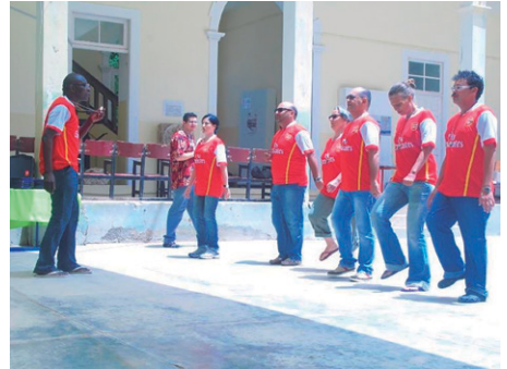
Fig. 11. Durante a performance "Isto é arte! Isto não é arte!". 2010, Mindelo, Cabo Verde.

É o último dos «Bailes Acadêmicos». A peculiaridade desta performance foi o facto de ter sido concebida no próprio congresso. Os integrantes da performance foram sete participantes do congresso de educação artística, três mulheres e quatro homens, de diferentes nacionalidades: Portugal, Moçambique, Cabo Verde, Brasil e Espanha.