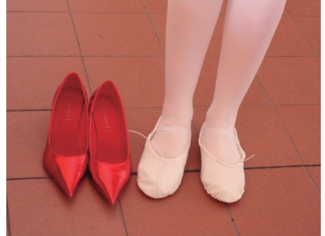
Fig. 4: Os sapatos de “Baile Académico I”