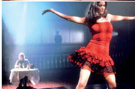
Figura 8 a e 8 b – Still de The forbidden dance , 1990. A “princesa amazônica” põe seu talento a serviço da causa ecológica.

Temos portanto um peculiar casal de protagonistas estadunidenses a interpretar uma parêlha de jovens amazônicos e depois a incorporar a “latinidade quente” da lambada como, naquele contexto histórico, uma expressão cultural típica da Amazônia. E tudo em nome de uma causa ecológica... Apenas a partir desta sinopse torna-se desnecessário comentar