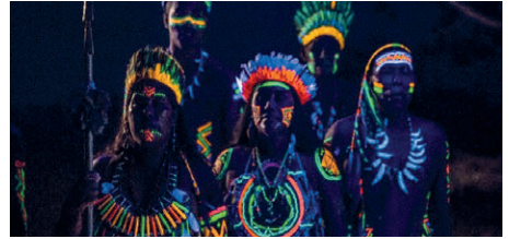
Figura 15 - Still de Los silencios , 2018.

representação da Amazônia no cinema; a realizadora se esquia de esquematismos, e, nesse processo, destaca o que há de universal nos conflitos delineados no roteiro (Figura 15).