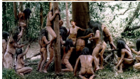
Figuras 6 e 7 – Stills de Cannibal holocaust , 1980. © Ruggero Deodato \ F.D. Cinematographica

De se notar ainda que este filme introduz um elemento novo para tramas desenvolvidas na floresta amazônica, que é a substituição da recorrente “equipe de exploradores e/ou cientistas” (impelidos por motivos bem-intencionados ou não) como protagonistas por uma equipe de cinema documental, mote que será repetido em filmes posteriores como Anaconda e dará vazão a um subgênero de filmes de ação e sobretudo de horror de grande influência a partir dos anos 1990, o found-footage movie . 9