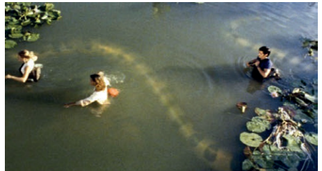
Figuras 4 e 5 – Stills de Anaconda , 1997.