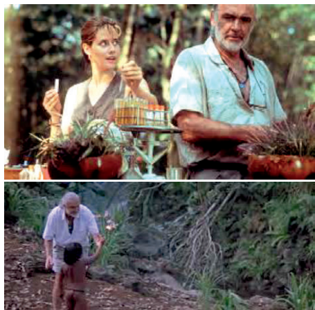
Figuras 11 e 12 – Stills de Medicine man , 1992.

Tem-se assim um registro híbrido de olhar sobre a Amazônia: por um lado ali é o lugar da pureza (e não do perigo e/ou da proverbial adversidade) e daquilo que pode salvar a humanidade de uma moléstia