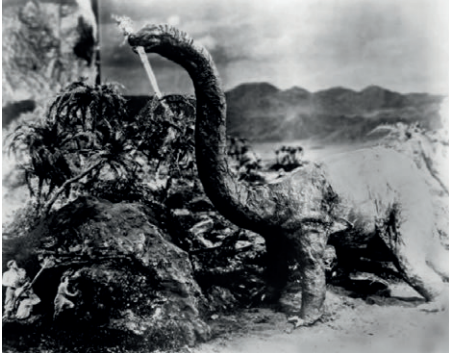
Figuras 1 e 2 – Creature from the Black Lagoon , 1954. © Universal Pictures. À esquerda, still de The lost world , 1925. © First National Pictures, Inc.

Gonçalves, documentarista e estudioso da questão do imaginário amazônico e suas relações com o cinema (enfatizando uma perspectiva regional), aponta o longa-metragem The Lost World , de 1925 (Figura 2) 4 , de Harry O. Hoyt, como um caso pioneiro emblemático da dinâmica apontada por Selda Costa: