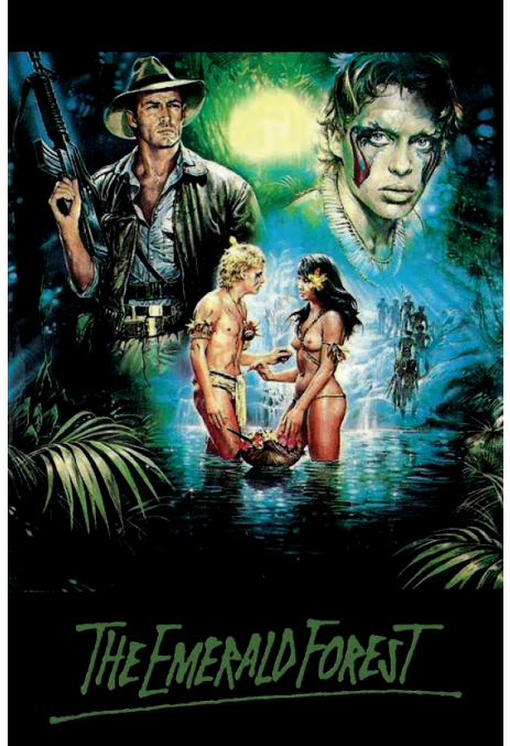
Figuras 9 e 10 – Still e poster de The emerald forest , 1985.

Ainda que de modo geral cuidadoso na representação dos índios e seus costumes, e esforçando-se para mostrar suas “boas intenções”, o filme abraça algumas concessões simplistas e/ou um tanto improváveis, como a relação entre o explorador branco e o aborígine silvícola, apresentada como um processo que se dá sem grandes dificuldades. Outro esquematismo tolo está na caracterização da tribo “má” (ou seja, inimiga da do protagonista) como um povo canibal, sempre um recurso-clichê para tipificar a natureza maligna extremada daqueles que não são subservientes ou – ano menos – interagem com o homem branco.