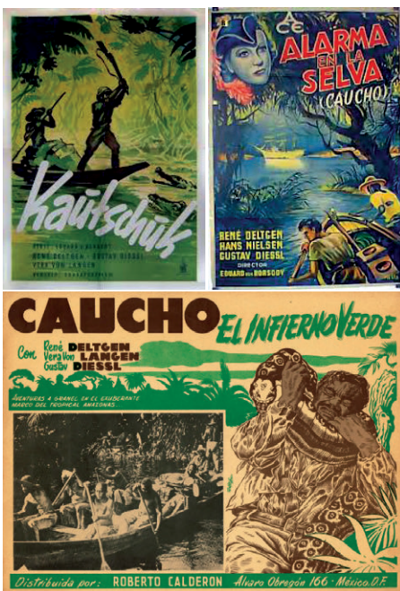
Figura 3 – Posters de Kautschuk (“O inferno verde”) da época de seu lançamento.

– “borracha” em alemão), do realizador austríaco (a serviço do regime nazista) Eduard von Bosordy, com cenas rodadas em grande parte na Amazônia e em estúdios na Alemanha. Essencialmente um filme de aventura carregando também no registo documental, narra o evento real protagonizado pelo explorador inglês Henry Wickham, que em 1876 contrabandeou sementes de borracha brasileiras (cuja exportação era proibida) para a Inglaterra, visando romper o monopólio do Brasil sobre o produto (o que ocorreu). O filme se apóia nos preceitos do cinema de aventura clássico, bem como no cinema etnográfico, gênero popular na Europa dos anos 1930. Em sua saga atrás de plantações de borracha, o protagonista Wickham adentra a selva amazônica (“o inferno verde”) e enfrenta ataques de índios com flechas envenenadas, de piranhas, de crocodilos e até mata uma anaconda gigante.