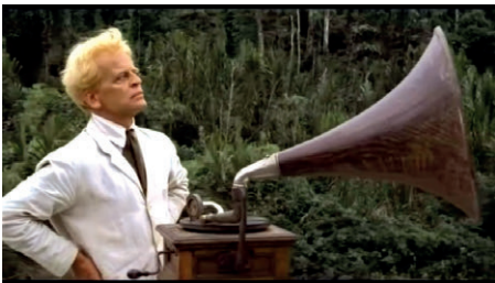
Figura 13 e 14 (abaixo) - Still de Aguirre . 1972. Figura 13 – Still de Fitzcarraldo , 1962.

Uma obra delicada e perturbadora em sua mirada amazônica é Los silencios (2018), da diretora brasileira Beatriz Seigner. Na trama, uma família se refugia na Isla da Fantasia, situada exatamente no ponto de fronteira fluvial onde convergem Brasil, Colômbia e Peru, e com tradição de abrigar fenômenos sobrenaturais. Na fuga dos conflitos armados das FARC, Amparo (a mãe) chega ao novo território com suas duas crianças e o marido Adão, numa convivência marcada pela rotina peculiar e pelo silêncio que dá título ao longa. Seigner capta bem o ritmo distinto da vida amazônica longe das capitais, expondo de forma sutil o moto-perpétuo dos ciclos da natureza no cotidiano e nos complexos dramas dos moradores da ilha, que lidam com perdas e traumas da guerrilha. A cheia do rio, os trapiches que se estendem pelas casas, a mata a postos na tentativa de invadir as marcas de civilidade do vilarejo, tudo se põe como personagem e relembra a todo instante as forças externas à vontade humana. Los Silencios desponta como um ótimo exemplo da