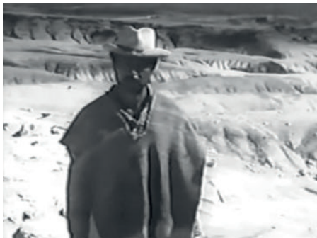
Imagen 1. Still La fórmula secreta (1965) Dir. Rubén Gámez 00:34:49