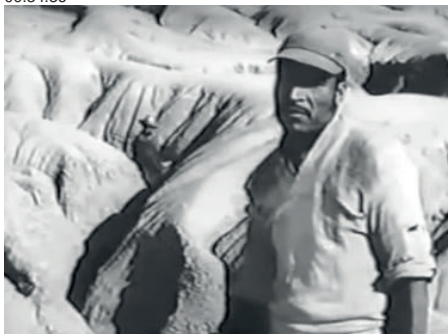
Imagen 3. Still La fórmula secreta (1965) Dir. Rubén Gámez 00:34:16