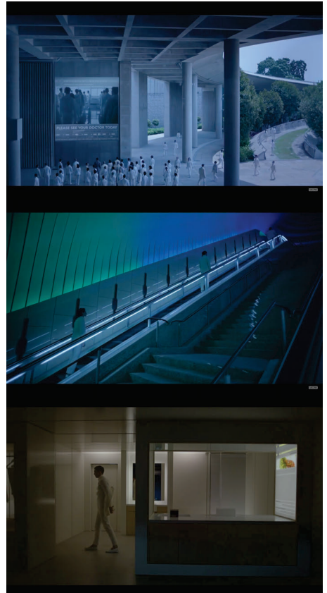
Figura 1 - Frames do filme Iguais .

Esse é o caso de filmes mais contemporâneos como Iguais 12 (Drake Doremus 2015) e Ex_machina 13 (Alex Garland 2014) (Figuras 1 e 2). No primeiro, a história se passa em um local com um visual similar ao de hospitais. Os ambientes são, em sua maioria, brancos, vazios e iluminados por uma luz fria, com toques pontuais de luzes coloridas. A aparência do concreto é recorrente em muitos ambientes, assim como a do vidro. Grande parte dos personagens, independentemente do gênero, veste um uniforme branco.