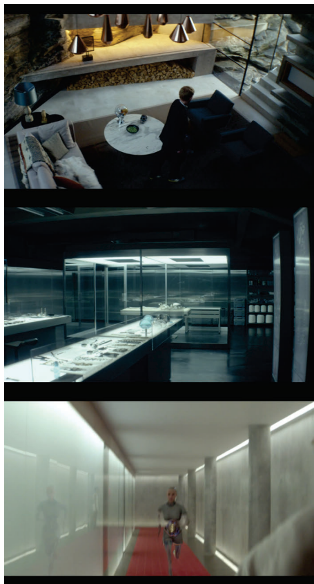
Figura 2 - Frames do filme Ex_machina .

A outra perspectiva constantemente utilizada em filmes futuristas é aquela na qual o futuro se apresenta de maneira menos imaculada e mais sombria e distópica. Em oposição à perspectiva anterior, observa-se a recorrente utilização das cores como preto, cinza, azul e, em menor quantidade, verde. Nos cenários, há a aparência constante de materiais variados como vidro, concreto, ferragens, fiações e até mesmo lixo. Nos figurinos, nota-se a presença de vinil, de couro e de tecidos rígidos, algumas vezes também mais sujos e rasgados, com marcas de uso.