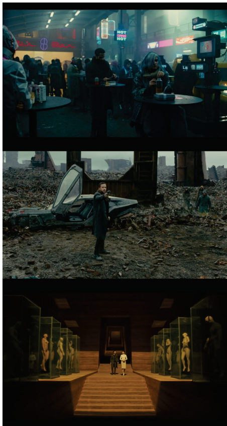
Figura 3 - Frames do filme Blade Runner 2049 .

A cidade é retratada por meio de um cenário escuro e repleto de fumaça, prédios, sinais luminosos e hologramas. Por outro lado, há também ambientes nada poluídos, constituídos por muitas linhas retas e ângulos precisos.