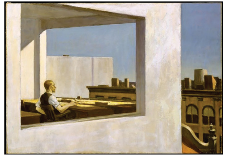
Figura 6 - Office in a Small City (Edward Hopper 1953).

Pode-se dizer assim que o filme aqui analisado, intencionalmente ou não, dialoga através da fotografia e da direção de arte para aproximar a ficção científica do contemporâneo, do futuro possível, de um realismo que muitas vezes o gênero de ficção científica busca, senão o oposto, apenas a verossimilhança. Assim sendo, encontra-se na relação entre o pintor Edward Hopper e as imagens do filme uma compreensão do conceito buscado pelo diretor. De acordo com Pascal Bonitzer, em Hopper também estão presentes