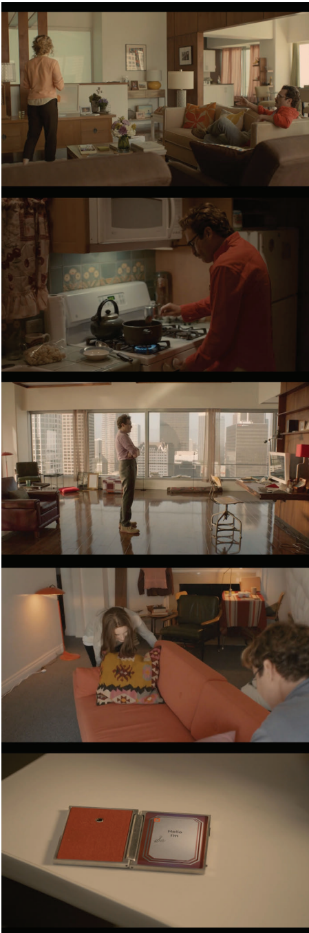
Figura 5 - Frames do filme Uma história de amor .