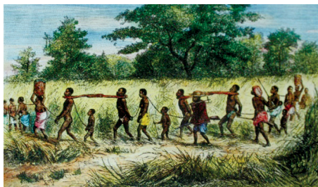
Imagem 5 – O libambo . Imagem do acervo iconográfico Granger Historical Picture. Alamy. Reproduzido do livro de Gomes, 2019.

Os estudos recentes têm apontado (...), que as pessoas negras produzem experiência a partir dos seus próprios referenciais e não só a partir dos referenciais trazidos e marcados pela escravidão. (Conceição, 2020, youtube).