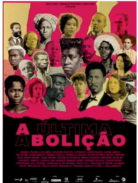
Imagem 2 – Um dos cartazes do filme veiculado na mídia.

Assim, pra focarmos mais na análise propriamente da narrativa estética que o documentário de Alice Gomes nos propõe, talvez possamos resumir bem a identidade visual do filme nos cartazes de chamada, veiculados pela mídia.