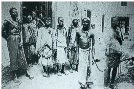
Imagem 4 – Escravizados antes do embarque em África.

parece completar em sua fala o que o documentário intenta afirmar.