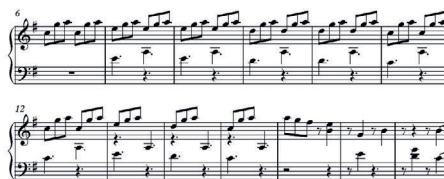
Figura 3- trecho retirado da partitura original Lobinhas (2019)

A música ganha acompanhamento da clave de fá a partir do compasso sete, ressaltando e contrapondo com as mesmas notas da clave de sol apenas uma oitava abaixo do tema que vem sendo tocado. Posteriormente, entre os compassos treze e quinze, por meio da liquidação do motivo musical 7 destaca-se no segundo tempo de cada compasso o isolamento de uma única nota que antecede o espectador para a próxima fase da música.