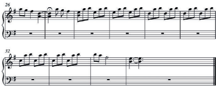
Figura 6 - trecho retirado da partitura original Lobinhas (2019)

A terceira parte é uma transição importante para o final, no qual retornamos por meio de uma hemíola (compassos 26,27) 8 , ao compasso vinte e oito a partir do intervalo Si-mi (4 o justa) às sequências em colcheias. Este retorno traz a nota “Si” como um acréscimo vindo da segunda parte da música, e intervalos maiores (mi-lá, ré-lá) em uma sequência similar a da introdução da obra, fechando o ciclo com características novas para demonstrar transformação, porém mantendo a essência da personagem. Tais características, antes ligadas a uma fase emocionalmente mais triste do filme, retornam resignificadas e elaboradas para representar o amadurecimento de Vivi. Além disso, os apoios de uma oitava mais grave são retirados a partir do compasso vinte e três, inspirado pela cena final onde Vivi está em um cenário completamente branco e representa sua independência montando em seu próprio lobo.