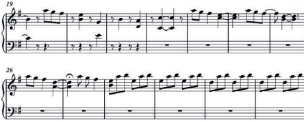
Figura 5- trecho retirado da partitura original Lobinhas (2019)

menores que vão crescendo, mas sempre com esse apoio. Esse trecho corresponde à fase de descoberta do quarto mágico pela personagem Vivi. Os desafios continuam fora deste quarto, mas lá Vivi encontra o suporte de diversas mulheres que dão uma escada emocional para a personagem compreender o mundo e a si mesma.