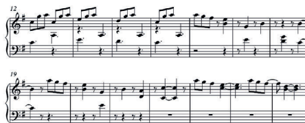
Figura 4- trecho retirado da partitura original Lobinhas (2019)

Todo esse trecho anterior remete a fase de mudanças e crescimento da personagem Vivi Lobo. Ela está em seu processo de infância, crescendo aos poucos com a ajuda de sua mãe e seu irmão. A escola nova é este grande passo para fora do lar, com novos desafios e questionamentos. A música passa assim entre os compassos dezesseis ao vinte e dois, a explorar uma oitava mais grave e ter acordes com intervalos maiores como Dó-si (7° maior) e Dó-dó (8° perfeita). As notas passam a ter uma duração maior e uma transição seca, sem ornamentos. A ideia é criar certo nível de tensão que corresponde a fase de bullying vivido pela personagem.