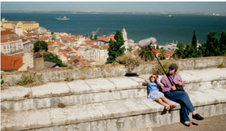
Figura 9— La búsqueda del paisaje sonoro.

La ciudad emerge en la búsqueda de sonidos de Philip: infancia en la calle, canciones, palomas, el tranvía, el puerto, barcos, el puente que atraviesa de lado a lado el tajo; partes de una ciudad que ahora acompañan al protagonista en sonido e imagen y que definen el descubrimiento de un paisaje. También conoce el mundo periférico del trapicheo, alejado del turismo. Es muy interesante como va recogiendo los sonidos de personajes de la película muda de Freidrich, así el afillador o las lavanderas, en un esfuerzo por descubrir la ciudad encontrando, porque es extranjero y solo puede observar y grabar en un intento de reflejo sonoro, donde solo tiene la pista de las imágenes, ya que su amigo no aparece y tiene que inventar la intención de su película, con lo cual elige explicar sonoramente Lisboa. A todo esto se suma el encuentro con el block de notas audiovisuales de Freidrich y su experimento, utilizar el audiovisual como un cuaderno sin interés narrativo, por eso nos indica que la ciudad solo se conoce en solitario.