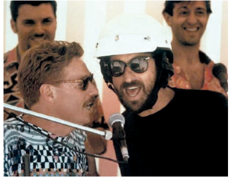
Figura 5— Paso al corte a su deseo.

La mirada es la reina de las relaciones, pero en esta secuencia aparece también el diálogo con unos observadores del baile a los cuales Moretti manifiesta su deseo de bailar bien. El director podría haberlo mostrado como con la canción, pero ese no es el estilo con el que se roza la ficción en la ciudad que construye la mirada de Moretti, la ficción se roza sutilmente. En este caso construye la ciudad desde la imaginación, desde el ocurrir o la manifestación verbal de lo que el director quiere que ocurra.