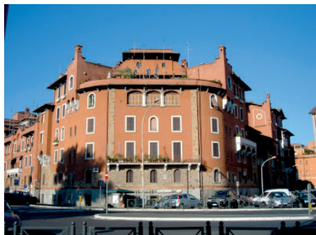
Figura 3— Travelling contrapicado en movimiento.

Con Moretti vamos a conocer los barrios, los espacios que conforman al habitante, donde las calles no son paisaje, sino territorio. Un territorio que se distingue del paisaje por ser habitado, por ser transformado por el ser humano. En el espacio urbano