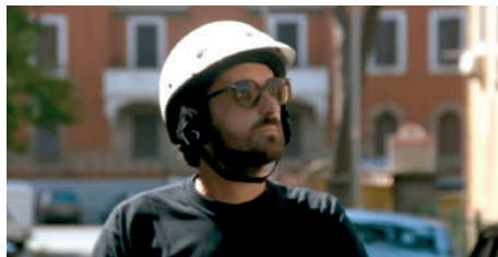
Figura 2— Mirada del personaje.