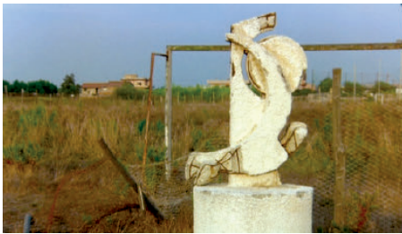
Figura 6— El espacio del olvida. Monumento a Pasolini.

Para finalizar este capítulo, Moretti nos enseña la ciudad olvidada, una nueva periferia, ya que nos lleva, siguiendo a su moto, hasta la playa de Ostia, donde está el monumento de homenaje a Pasolini. El lugar es tan inhóspito y abandonado, que no hace falta saber cual es la opinión sobre el trato de esta ciudad al director de Accattone (1961), ya que los planos del monumento nos explican el poco cuidado a su memoria. Está será la última visión de esa idea de la ciudad periférica que el nativo tiene en mente, una ciudad de Roma construida por contrastes. En el resto de la película la ciudad se verá enmarcada por una ventana, donde el hombre desacoplado va a encontrarse en una ciudad de planos generales, ahora con atascos y ruidosa.