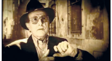
Figura 10— Oliveira: el límite ficción-realidad.

anticipado en la secuencia en la que aparece Manoel de Oliveira para plantear que el cine puede definirse como la posible memoria de una ciudad, la garantía del reflejo del momento. En esta última parte Freidrich quiere hacer una “cinemateca de imágenes no vistas”, porque cuando las imágenes se ven dejan que las cosas se vayan y la ciudad es como la vemos no como es. Philip apelara a la posibilidad de conmovier desde la mirada, desde la mirada del extranjero, buscando las imágenes indispensables, como decía Vertov: “unos films un poco defectuosos, pero en todo caso unos films necesarios, indispensables, unos films dirigidos hacia vida y exigidos por la vida” (Vertov, 2011, p. 196).