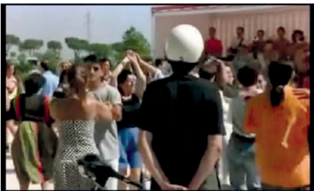
Figura 4— Observa su deseo.

En este sentido, vamos a destacar tres secuencias. La primera es una escena que tiene que ver con la expresión de un gusto personal del director que, al mismo tiempo, permite la descripción de un rasgo de la ciudad. Moretti nos conduce con su moto hasta un baile en la calle, dando paso a través de su voz a su deseo de bailar bien. Describe algo típico de Roma, los bailes populares, pero, al mismo tiempo que hace una descripción documental, como el vecino que da un paseo, utiliza una planificación cuyo objetivo es mostrar los sentimientos que este ambiente cotidiano provoca en el director. Debemos advertir que la música, que no es otra que Visa para un sueño de Juan Luis Guerra, la cual va a igualar tanto los cambios de montaje como su llegada en moto desde la ciudad, donde ya había empezado. Es interesante como el montaje de esta secuencia muestra el deseo de Moretti, el cual pasa directamente en un corte de estar observando el baile y la orquesta, a formar parte de los músicos y cantar con ellos, como si todo ocurriera en un espacio físico (la mirada del nativo) pero construido con los ladrillos de lo que le apetecería al protagonista, de lo que pasa en su mente, volviéndose a romper esa frágil barrera de la ciudad cotidiana y la ciudad del deseo, lo que recuerda a Calvino cuando en Las ciudades Invisibles agrupa a diferentes urbes inventadas bajo el nombre de “Las ciudades y el deseo”, dando importancia a la mirada sobre la ciudad, al arte o al espectáculo que contiene.