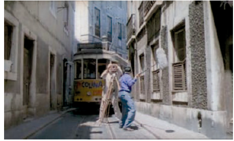
Figura 7— Lisboa: Tranvías, tiempo, cine y paisaje sonoro

Para analizar Lisbon Story debemos saber que ya Wenders había tenido otras incursiones en Lisboa a través del cine, como en su película El estado de las cosas (1982), con esas secuencias en el bar Texas, que remiten a un espacio mítico del cine Portugués. La ciudad que se presenta en este caso es la ciudad para alguien que no sabe nada de ella, el viajero que no conoce que se va a encontrar. En cuanto Philips llega a Lisboa, por la ayuda de un camionero, descubrimos que el espacio y los tiempos han cambiado, de hecho paran a un tranvía para que el conductor nos informe de cómo puede llegar a su destino: cine, tranvías y tiempo podría ser la definición de Lisboa de esta película, solo faltaría, como explicaremos, el paisaje sonoro.