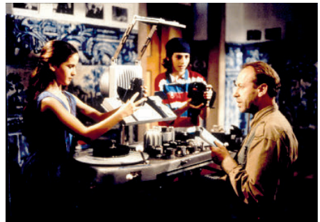
Figura 8— Mirar la ciudad a través de una mesa de montaje y de la infancia.

Para el extranjero y su sensibilidad de desconocedor, Lisboa es mostrada por Wenders como un misterio, igual que En la ciudad blanca (1983) de Alain Tanner. Al llegar a la casa vacía de su amigo los azulejos en las habitaciones nos muestran que estamos en Portugal. Su primer encuentro de diálogo con personas, lo hará con la infancia, un grupo que está en la casa y también buscan a Friedrich Munro. Estas criaturas son la representación de la inocencia, de las ganas de sorprenderse y el sonidista se nutrirá de ellos como espectadores, no mostrando aun su mirada sobre la ciudad, sino sobre su profesión. Hay una secuencia que parece ser como una declaración de intenciones. Nos referimos al momento en el que Philip escondido hace sonidos con objetos para que los niños y niñas del grupo adivinen que podría significar, parece decirnos que el sonido provoca un paisaje, como planteaba el director de cine Robert Bresson (1995). Las calles que recorre Philip son las que ve también del rodaje de Friedrich en la mesa de montaje, dándonos una pista de cómo la ciudad se construirá cinematográficamente. Philip, durante las secuencias en las que ve la ciudad en la mesa de montaje reconstruye el pasado, se convierte en un detective que busca a su amigo y que encuentra a Lisboa, reflejado en el amor hacia la cantante de Madredeus.